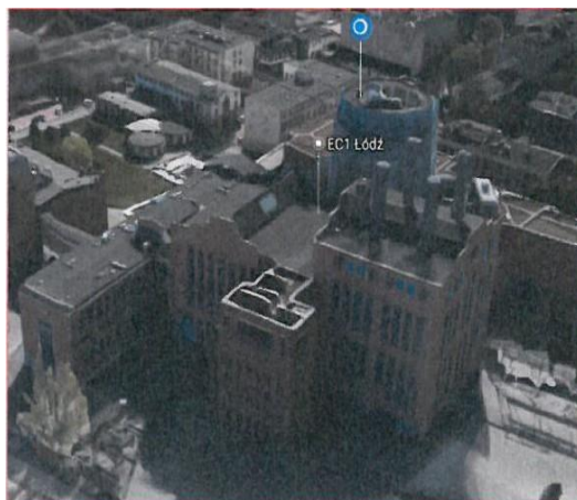
Centrum Nauki i Techniki (EC1 - ZACHÓD)

1.2 — sprzątania i utrzymania czystości terenów zewnętrznych wokół budynków całego kompleksu EC1 1 ;